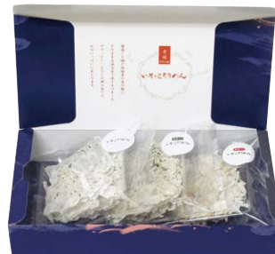
お土産やギフトに「いそっこちりめん」