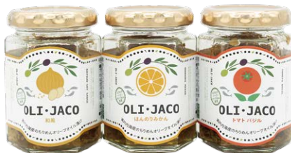
じゃこをオリーブオイル漬にした「OLI-JACO」

オカベの最大の強みは、徹底した現場主義が生み出す「商品開発力」です。営業や販売店を通じて、消費者の細かなニーズをリアルタイムにリサーチ。得られた情報は、企画・デザイン・ネーミングへ即座に反映されます。