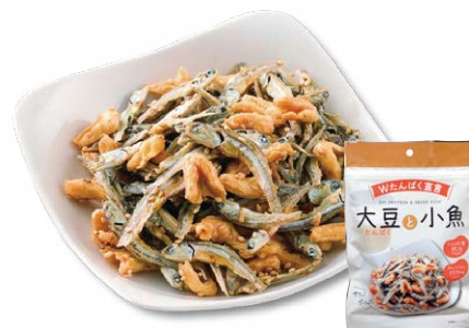
カルシウム&たんぱく質たっぷり「大豆たんぱくと小魚」