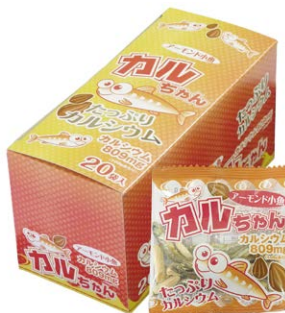
給食でおなじみ！「カルちゃん」

「おつまみ」を「天然のサプリメント」へ。小魚が持つ豊富なカルシウムに着目し、学校給食への導入や、健康志向層向けに大豆たんぱく商品の展開など、全世代の健康に貢献しています。