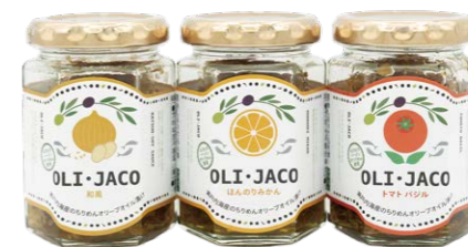
じゃこをオリーブオイル漬にした「OLI-JACO」

オカベの最大の強みは、徹底した現場主義が生み出す「商品開発力」です。営業や販売店を通じて、消費者の細かなニーズをリアルタイムにリサーチ。得られた情報は、企画・デザイン・ネーミングへ即座に反映されます。