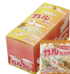
給食でおなじみ！「カルちゃん」

「おつまみ」を「天然のサプリメント」へ。小魚が持つ豊富なカルシウムに着目し、学校給食への導入や、健康志向層向けに大豆たんぱく商品の展開など、全世代の健康に貢献しています。