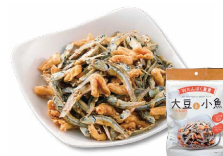
カルシウム&たんぱく質たっぷり「大豆たんぱく小魚」