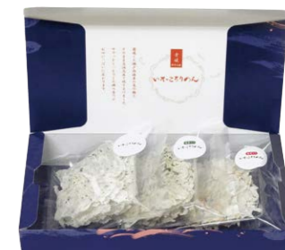
お土産やギフトに「いそっこりめん」