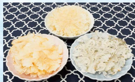
そのまんまシリーズ

イワシ、アジ、キビナゴ、舌ビラメ、エビを独自製法の味付けで絶妙なバランスでブレンドしています。