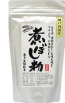
SP瀬戸内海産煮干粉