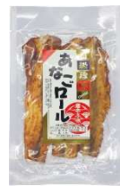
穴子ロール唐辛子味