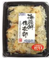
APTNo.1イトヨリ鯛 ロール (ほぐし)