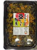
APT330(黒) 3色の豆いわし佃煮