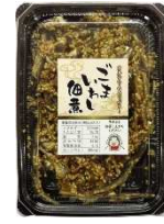
APT330(黒) ごまいわし佃煮