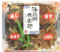
パンカク焼き 4点セット (シュリンク)