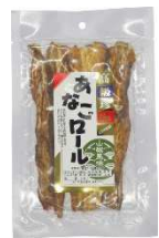
穴子ロール山椒風味