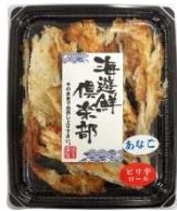
APTNo.1穴子ピリ辛 ロール (ほぐし)