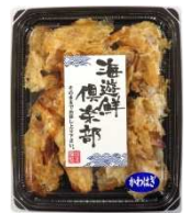
APTNo.1ハギ ロール (ほぐし)