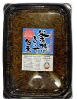
APT330(黒) 釜揚げしらす佃煮