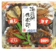
パンカク浜焼 4点セット (シュリンク)