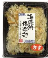
APTNo.1焼キス ロール (ほぐし)