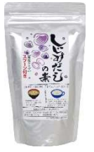
アルミSP しじみだしの素