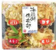
パンカクほぐし 4点セット (シュリンク)