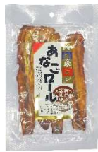
穴子ロール焦がし醤油味