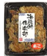
APTNo.1焼あご ロール (ほぐし)